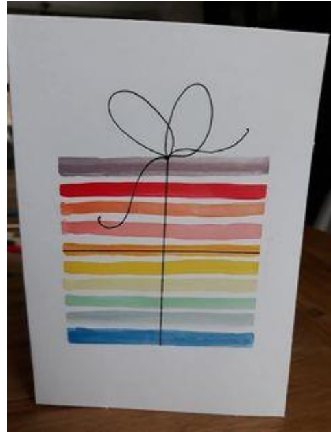
Abbildung 3: Die fertigen Schnipselkarten (links mit Tannenbaummotiv und rechts mit Geschenkmotiv).

Für diese Karte musst du aus möglichst verschiedenen, farbigen Papieren Streifen in verschiedenen Längen schneiden. Nachdem du dies getan hast, klebe die Streifen so auf, dass es entweder ein Tannenbaum, ein Geschenk und sonst ein Motiv deiner Wahl ergibt.