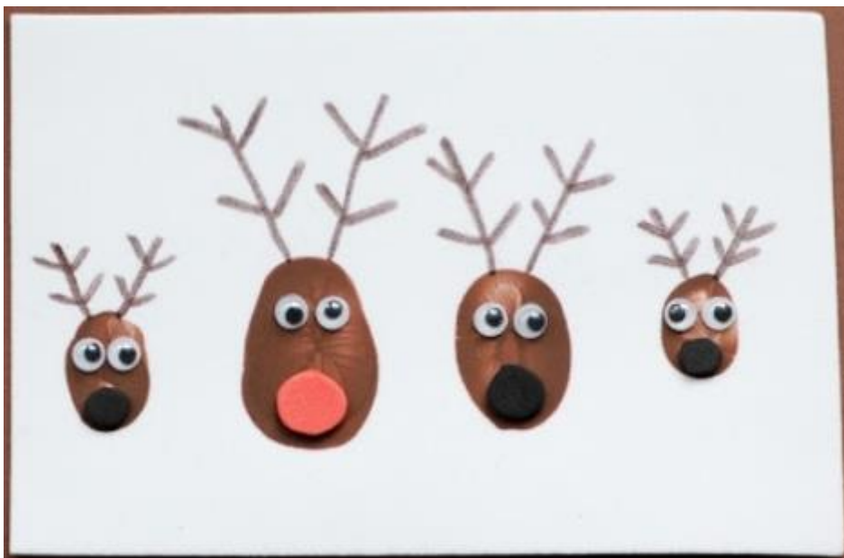
Abbildung 2: Die fertige Rentierfamilien-Weihnachtskarte.