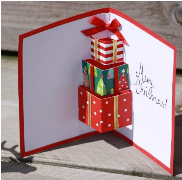
Abbildung 5: Die fertige 3D-Karte.

Bei dieser letzten Karte, handelt es sich um eine absolut komplizierte Karte. Da ich selbst nicht in der Lage bin, die Anleitung für diese Weihnachtskarte nur im Ansatz wiederzugeben, habe ich euch eine Video-Anleitung herausgesucht, welche ihr unter folgendem Link findet: