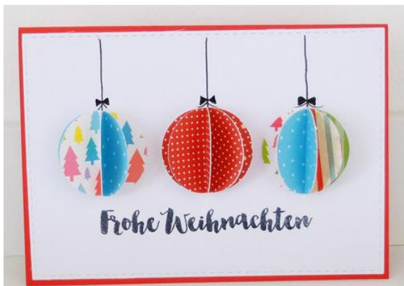
Abbildung 4: Die fertige Weihnachtskugelkarte.